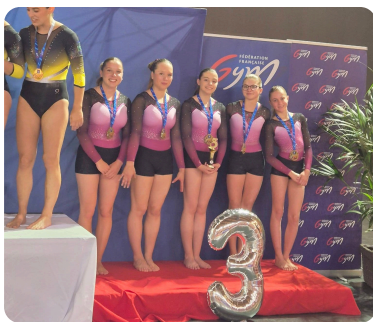
GAF: FOLSCHVILLER, 3ème en FEDERAL A2 10 et +