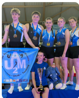
TR: UA2M 1er en FEDERAL