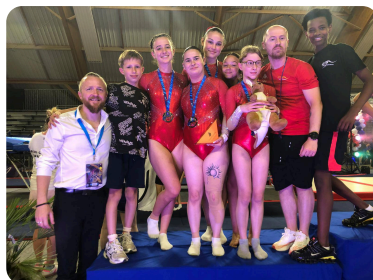
TR: TGA SAINT AVOLD 2ème en FEDERAL