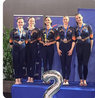
GAF: SAREGUEMINES 2ème EN FEDERAL A1 14 et +