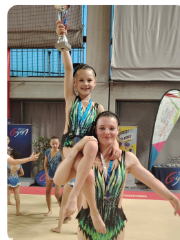
GAC: MERLEBACH: 2ème en toutes catégories DUO